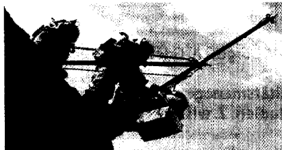
Abseilen des Helfers mit dem Zweibein der Tiroler Bergrettung. Lesen Sie mehr zur simulierten Marsexpedition ► ab Seite 653