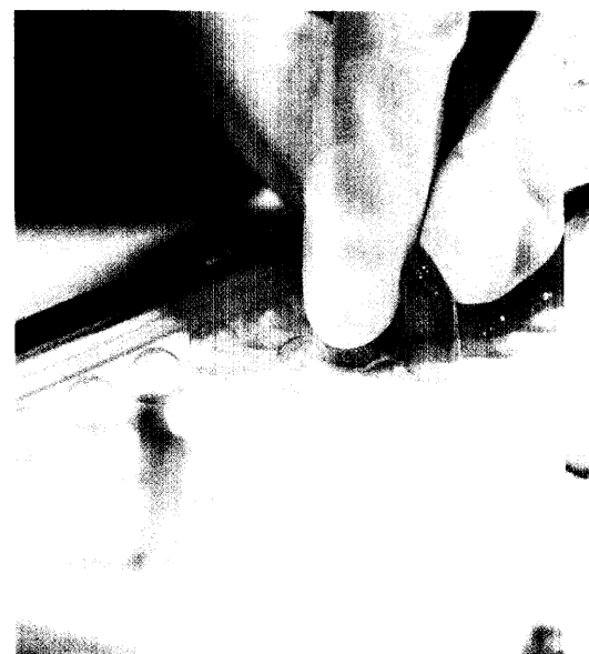
Die im NRF 2005 erschienene Monographie »Hydrochlorothiazid-Kapseln« für die pädiatrische Verwendung wurde kontrovers diskutiert. Anlass genug, die Herstellung einer kritischen Untersuchung zu unterziehen. Seite 26