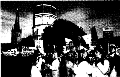
Rund 10 000 Apotheker, PTA und PKA aus vier Bundesländern demonstrierten auf dem Düsseldorfer Burgplatz gegen die Gesundheitsreform. Seite 8

Apothekerproteste: Wir sind keine Pillenverkäufer