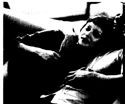
Rheuma ist heutzutage für Frauen kein Grund mehr, auf eine Schwangerschaft zu verzichten. Jedoch bedarf die Familienplanung einer besonderen medizinischen und pharmakologischen Betreuung. Seite 30