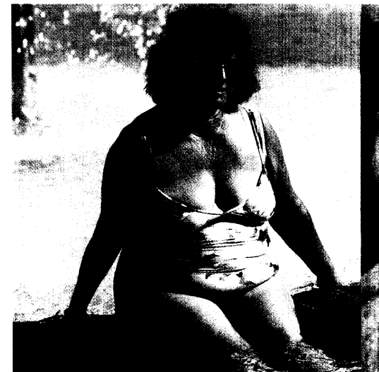
Kürzlich scheiterte ein neuer Kandidat für ein Antiadiposium in klinischen Studien. Der Fall zeigt erneut, wie schwer die Fettsucht medikamentös zu behandeln ist. Seite 26