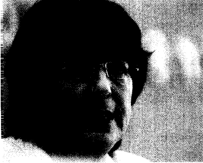
Bundesgesundheitsministerin Ulla Schmidt ist mit dem Reformentwurf zufrieden. Außerhalb der Koalition hält sich die Euphorie in Grenzen. Seite 8

Gesundheitsreform: Nur für Schmidt ein »gutes Gesetz«