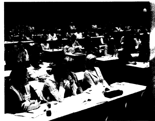
Trier machte am vergangenen Wochenende den Auftakt: In der Römerstadt trafen sich rund 300 Apothekerinnen und Apotheker, um sich beim diesjährigen Wochenendworkshop »Patient und Pharmazeutische Betreuung« in spannenden Vorträgen und Seminaren fortzubilden. Seite 28