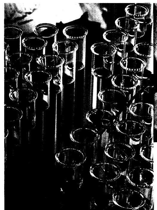
Efeuextrakt gehört zu den wenigen Phytopharmaka, deren Wirkmechanismus auf molekularer Ebene geklärt ist. Mithilfe der Fluoreszenz-Korrelations-Spektroskopie sind ihm Forscher nun erneut ein Stück näher gekommen. Seite 30