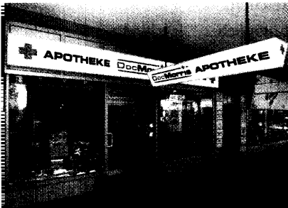
Aus für DocMorris. Auf Anordnung des Verwaltungsgerichts Saarlouis musste das Gesundheitsministerium die Saarbrücker Filiale schließen. Seite 18

DocMorris: Verwaltungsgericht schließt Filiale in Saarbrücken