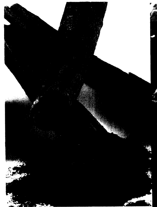
Die antidiabetische Wirkung von Zimt wurde in zahlreichen Studien untersucht. Welche Effekte gelten derzeit als wissenschaftlich belegt? Seite 24