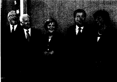
Die Regierung gibt sich optimistisch. In Fachkreisen ist man jedoch skeptisch gegenüber der Gesundheitsreform. Seite 8

Gesundheitsreform: Die große Koalition will die Landschaft revolutionieren