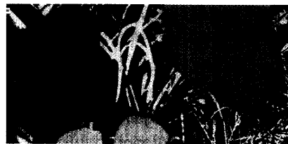
Andy Warhol: Auch in diesem Jahr holten die Internationalen Tage einen ganz Großen der Kunstszene nach Ingelheim. Seite 54