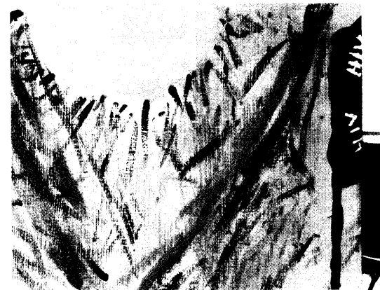
Die moderne HIV-Therapie setzt auf fixe Kombinationen, beachtet individuelle Risiken und Langzeitverträglichkeit. Zudem fördert sie durch vereinfachte Therapieschemata die Compliance. Einen Überblick lesen Sie ab Seite 20.