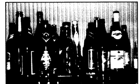
Alkoholnotfälle im Rettungsdienst