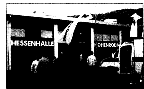
Neues vom DRK-Symposium in Hohenroda