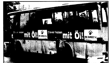
Wieder ansteigende Zahl an Busunglücken