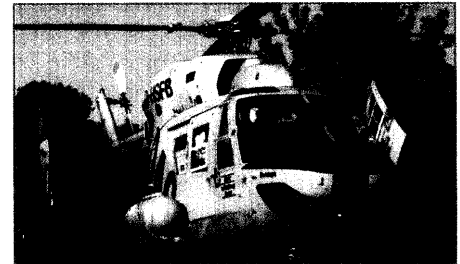
Drei Fragen an drei Praktiker aus der Luftrettung