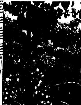
Kaffeeepflanze ( Coffea arabica , Rubiceae).