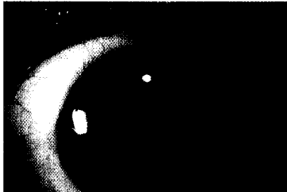
Vordere Synechie bei iridokorneo-endothelialelem Syndrom ▶ Seite 1057