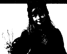
Carl Larsson Brita als Idun (1900) Bildbetrachtung auf Seite 336 dieser Ausgabe