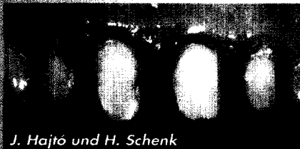
J. Hajtő und H. Schenk Therapeutische Prototypen Im Frontzahnbereich bei kompromittierter Parodontalsituation