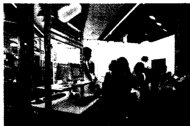
Fachdental Südwest Was zählt ist Qualität