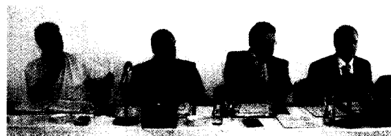
Vertreterversammlung der BZK Tübingen am 21. September 2006 in Lindau Mehr Aufwand durch Hygienerichtlinien