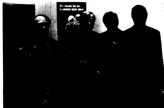
Die Bereitschaftspraxis im Münchner Elisenhof feierte ihr zehnjähriges Bestehen.