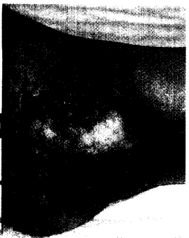
Tiefe Ulzeration über dem Außenknöchel, Fersenulkus.