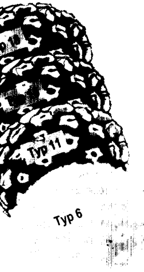
Onkologische Revolution durch HPV-Impfstoff Seite 13