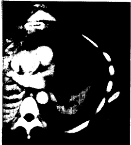
Einbruch eines kleinzelligen Bronchialkarzinoms in das linke Atrium.