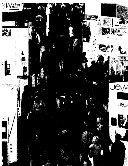
Besucherströme auf der Rehacare.

1. Bauerfeind Branchenforum: Bündnis zur Zukunftssicherung 15