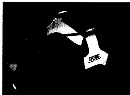
Innovatives, das der Früherkennung, Prävention, Diagnose und Therapie von Krankheiten dient, finden Sie auf unseren Produktseiten.