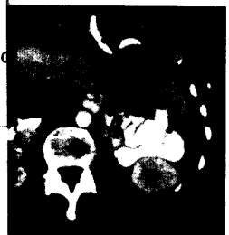
Epigastrisches Hämatom vor und nach der CT-gestützten Punktion.