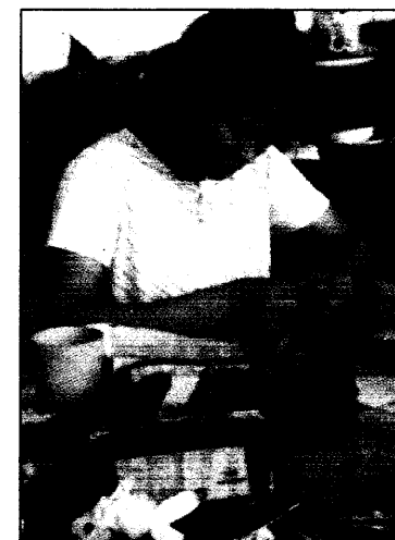
Eine Chinesin fertigt von Hand Akupunkturnadeln.