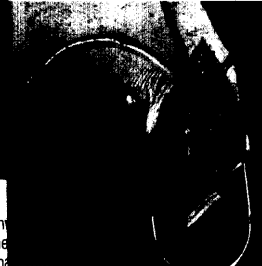
Vene als primäres Bypassmaterial von Vorteil.