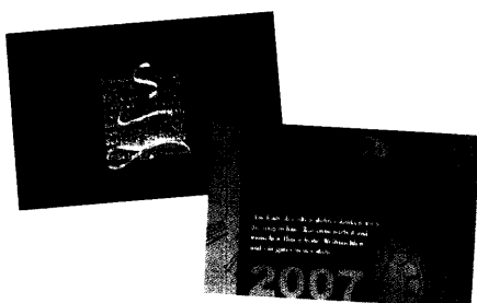
Jetzt bestellen: Weihnachtskarten 2006 der DKG