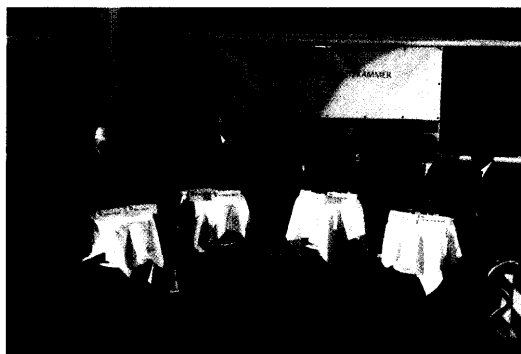
Podiumsrunde am 62. Bayerischen Ärztetag.