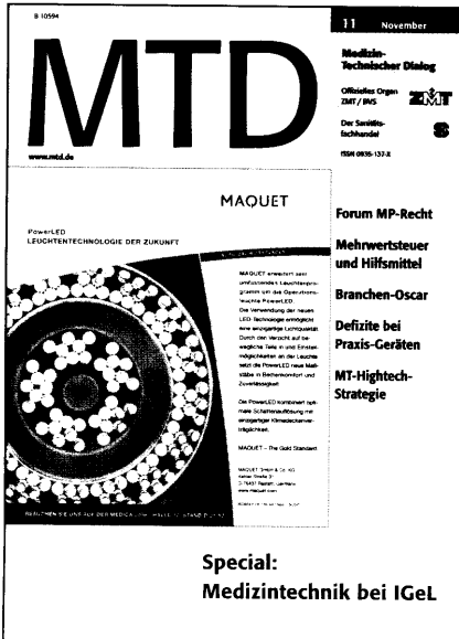
Special: Medizintechnik bei IGeL