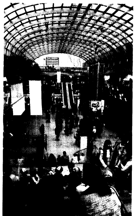
Ein internationaler Treffpunkt: die Medica in Düsseldorf.