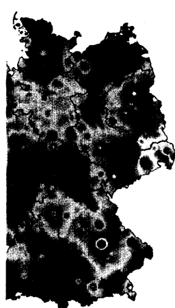
Farbkodierte Inzidenz akuter respiratorischer Erkrankungen.