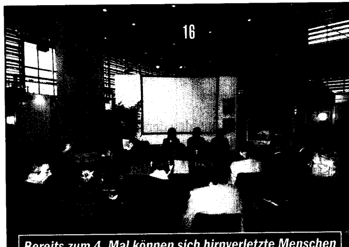
Bereits zum 4. Mal können sich hirnerkrankte Menschen auf der RehaCare auf dem eigens für sie konzipierten „Treffpunkt Gehirn“ informieren und austauschen.