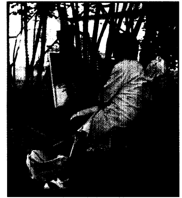
Kunsttherapie im Offenen Atelier