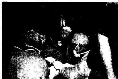
Hypospadioperation im Operationssaal der Urologischen Klinik Mainz, April 1992