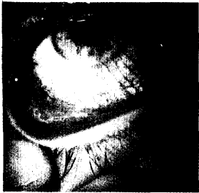
Konjunktivale Hyperämie als Zeichen einer akuten bakteriellen Konjunktivitis.