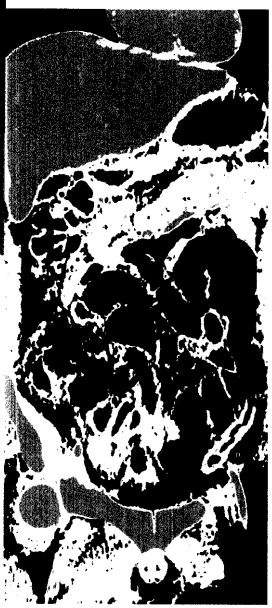
Titelbildvorlage: Mediquiz siehe Seite 1941.