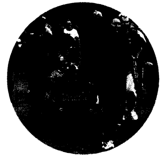
Zweiter „Lauf ins Leben“ am 13./14. Mai in Schleswig-Holstein