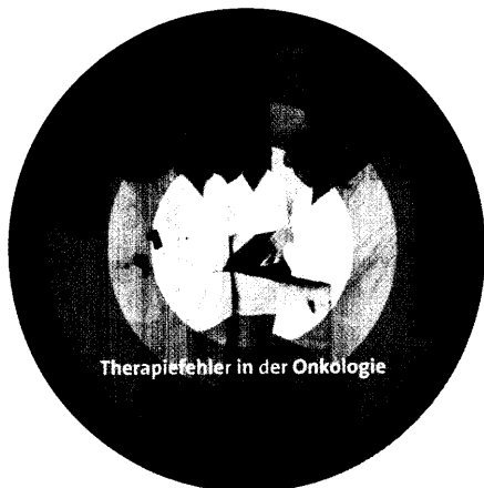
Therapiefehler in der Onkologie

... Neuauflage pünktlich zum Krebskongress 2006