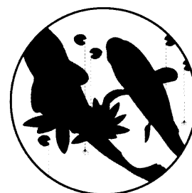
Selbsthilfe für Angehörige