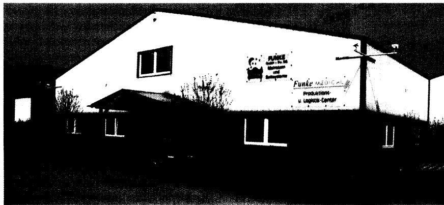
Ausschließlich in Raesfeld fertigt Funke Medical seine Wechseldrucksysteme.