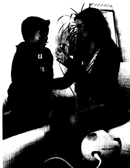
Die Feuchtinhalation verbessert die Compliance bei Kindern und Jugendlichen.