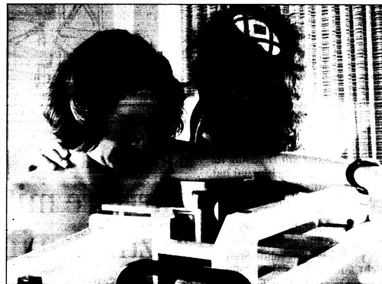
Mammographie: Hiermit können Karzinome in der Brust früh erkannt und

Damit sich mehr Frauen für den Beruf entscheiden, brauchen sie mehr Unterstützung. Zusammen mit der Kassenärztlichen Bundesvereinigung plant der Ärzten-