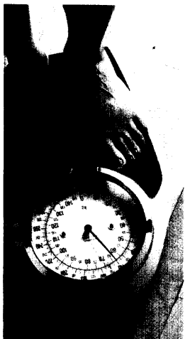
Im Kampf um Gewichtszunahme und Gewichtserhalt hilft das Antidepressivum Fluoxetin nicht.