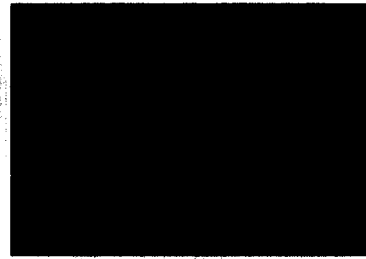
Antibiotikahaltiger Knochenzement verringert die Revisionsrate bei Endoprothesen (S. 30).