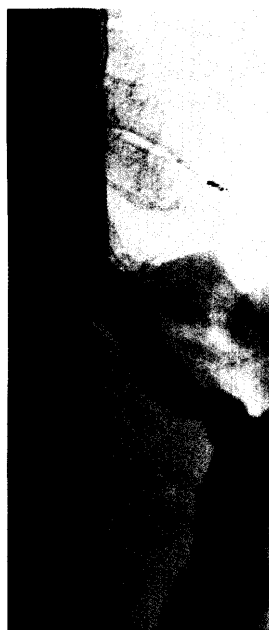
Titelbildvorlage: Ösophagusbreischluck nach Heller-Myotomie bei Patienten mit Achalasie und zirkum- skripten Sklerodermie (s. dieses Heft S. 1801).