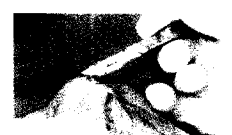
Ziel: Entfernung im Gesunden