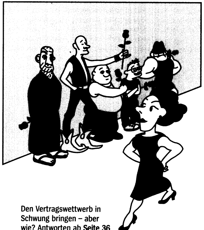
Den Vertragswettbewerb in Schwung bringen – aber wie? Antworten ab Seite 36