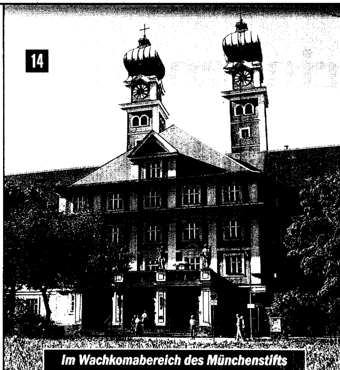
Im Wachkomabereich des Münchenstifts in München gehören verschiedene Therapien zum Betreuungskonzept für die Bewohner.