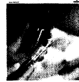
Unser Titelbild: