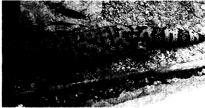
Das Gift der Krustenechse ist die „Blaupause“ für die Inkretine.

Für Diabetiker ist ein neues Therapieprinzip im Anmarsch, das seinen Platz zwischen oraler Therapie und Insulin finden dürfte: die Inkretine. Sie stimulieren – ab-