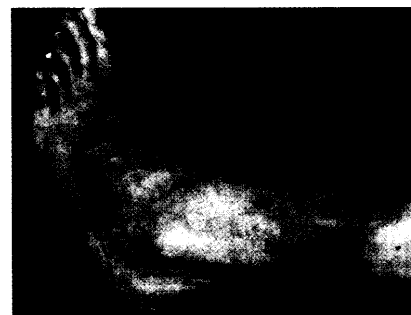
Abb.: C. Diehm

Das ist keine venöse Insuffizienz! Wenn das subkutane Fettgewebe schmilzt, sich die Haut bräunlich verfärbt und nach Zurückgehen der Ödeme dünn wie Zigarettenpapier wird („Acrodermatitis chronica atrophicans“), kann die Ursache lange zurückliegen... Seite 49